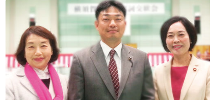
日本共産党の政策と見解を紹介します。