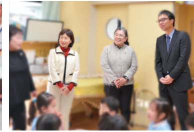
市内の保育園・幼稚園を視察