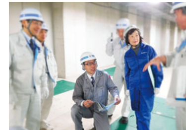
三春町の下水処理場を視察