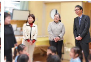
市内の保育園・幼稚園を視察