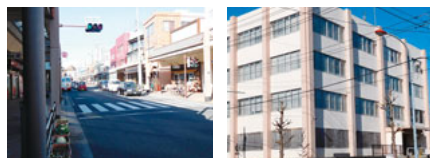
商店街（左）の振興策と活性化が求められる税務署跡地（右）