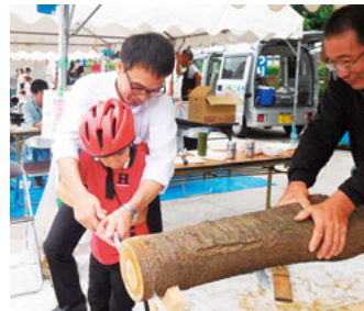
土建まつりで丸太切りに挑戦

公立保育園の整備、学童保育の保護者負担を軽減するよう求めるなど、保育の質と充実を訴えてきました。