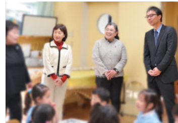
市内の保育園・幼稚園を視察