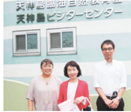
天神島ビジターセンター

閉鎖が予定されていた万代会館と天神島ビジターセンターが地域のみなさんの運動が実って存続されることになりました。これからもみなさんと力をあわせて取り組んだ経験を生かし、貴重な文化的・歴史的遺産を守り、継承していくために全力を尽くしてまいります。