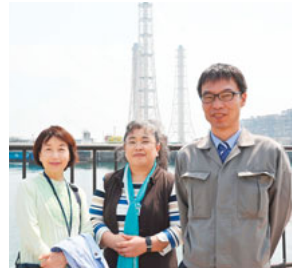
うしろは解体中の東電横須賀火力発電所