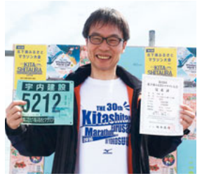
完走証を手にニッコリ