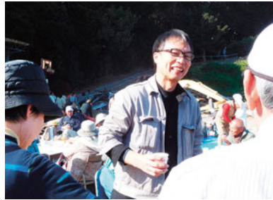
地域のみなさんと歓談