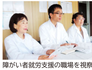
障がい者就労支援の職場を視察