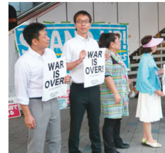
戦争法反対のスタンディング