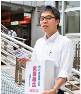
被災地に心を寄せて