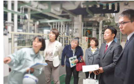
芦名にある神奈川県環境センターを県議団とともに視察